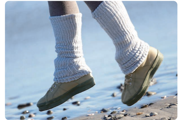
天然色素 クチナシの実

絹と炭の靴下 ¥2,200、絹と炭のレッグウォーマー ¥2,200、絹と炭の腹巻スパッツ ¥6,930 (すべて税込) 色はピンクとグレー、腹巻スパッツはグレーのみ