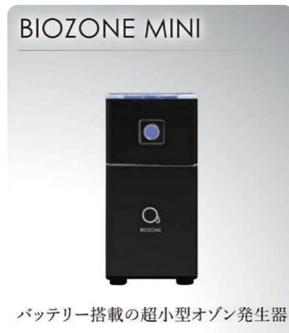
バッテリー搭載の超小型オゾン発生器