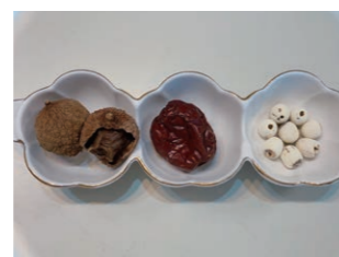
なつめや、もち米飴は店頭で販売しております。気になる方はスタッフまでお問い合わせください。