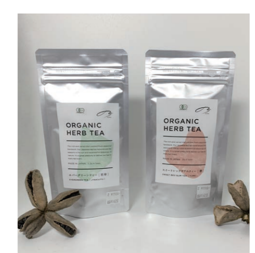
オーガニック ハーブティー 10袋入り 全6種 ¥1,620(税込)

漢方もハーブも植物のパワーによって人々の健康の役に立っています。なぜ植物が人に役立つのでしょうか？動物にはよりよい環境に移動するための足がありますが、一方で植物は動けないため自らを守る方法が異なります。そのため、乾燥・紫外線や敵となる動物・病原菌から身を守るための術を身につけています。たとえばバラのトゲも生きる術のひとつです。この蓄えた力が人々の役に立つ理由です。人は自然の恩恵を受けて生きているのだと改めて感じますね。 植物のパワーを日常的に取り入れられるために、オリジナルのハーブティーを作りました。それぞれ目的や気分に合わせてブレンドしているのので、お好みに合わせてご賞味ください。 「スイートレッドスリムティー」 肉体的疲労や眼精疲労によいハーブティーです。クエン酸やミネラルを含むため新陳代謝を高め、疲労を回復してくれます。 「リフレッシュブレンドティー」 ミントの爽やかな香りが脳をリフレッシュし、レモングラスの香りがその効果を持続させます。集中力を高めたい時や、受験生におすすめです。 「ジンジャー・カモミールティー」 ジンジャーの血行促進作用とカモミールの消炎作用が相乗効果を発揮し、皮膚のあれや乾燥を鎮め、健やかに保ちます。 「メディカルフラワートイ」 疲労回復に良いローズヒップとハイビスカスにさっぱりとしたウロンをブレンドしました。日常の水分補給としてどうぞ。 「エバグリーンティー」 ホーステールに含まれるケイ素はカルシウムとともに骨を強くする働きがあります。ミシマサイコはストレスを緩和する漢方薬に多く取り入れられる生薬です。更年期から摂取したいハーブティーです。 「グッドナイトドリームティー」 太陽の光が降り注ぐ地域で育つオレングの香りは、冷えた心と体を温めます。眠れないときや神経興奮が冷めないときのリラックスに。