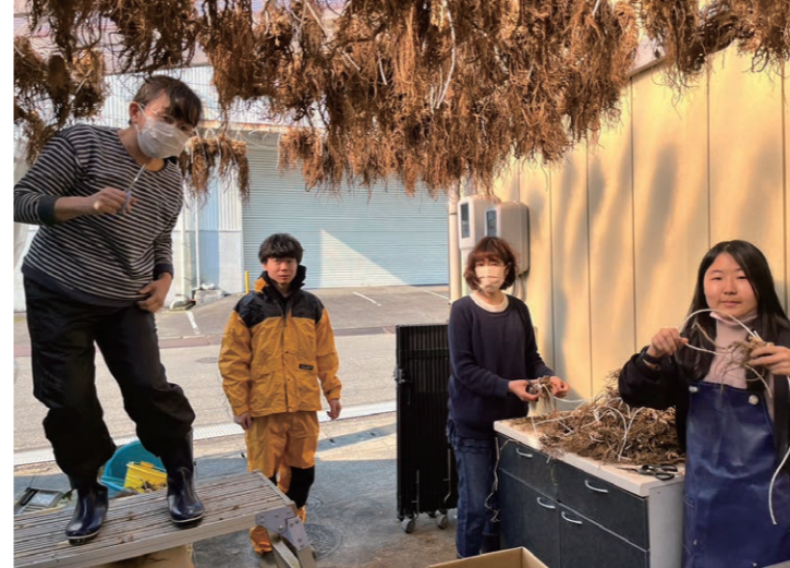
みんなで当帰の湯もみをしました

胃は食べ物を消化しますが、粘液を分泌し自分を守っています。ストレスで胃が痛くなるのはなぜでしょうか？ストレスのため交感神経が活発な時間が長いと自分の守る粘液があまり出ていない状態になります。すると、副交感神経に切り替わった時に、反動でドバッと出てしまう胃酸から自分を守る事ができなく傷つき痛みます。漢方薬で胃腸の血流をよくするとリラックスしやすくなるので胃の痛みがなくなっていくます。