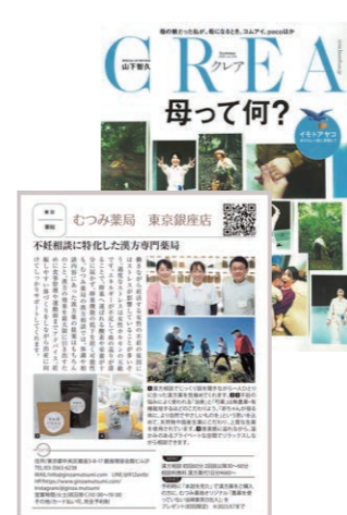
CREA夏号で東京銀座店(むつみ薬局)を紹介いただきました