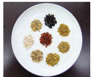
温清飲 (ウンセイイン)